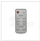
Telecomando per selezione ingressi